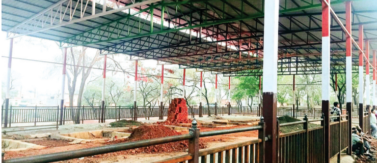
हरिभूमि न्यूज अशोकनगर

जिला मुख्यालय अशोकनगर का जो मुख्य शमशान स्थल है जिसे मुक्तिधाम के नाम से जाना जाता है। इस मुक्ति धाम को अशोकनगर नगर पालिका नया लुक प्रदान कर रही है। यहां आने वाले आम जनो की सुविधाओं के लिए नए शोड का निर्माण भी किया जा रहा है, ताकि एक साथ 8 लोगों के अंतिम संस्कार किए जा सकें। बैठने के लिए दो पवेलियन भी बनाए जा रहे हैं ताकि लोग आसानी से यहां बैठ सकें। यह शमशान स्थल सन 1961 से यही चल रहा है कई अनेक लोग तो ऐसे हैं कि जिन्होंने शमशान स्थल के रूप में इसी स्थान को देखा है पहले यहां छोटा सा शमशान स्थल हुआ करता था। उसके बाद जगह कर पड़ने लगी जिसके बाद फिर एक और शोड का निर्माण किया गया। लेकिन आज भी यहां पर्याप्त इंतजाम अंतिम संस्कार के लिए आने वाले लोगों को नहीं मिलते हैं इसी स्थान पर नगर