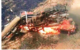
हरिभूमि न्यूज अशोकनगर