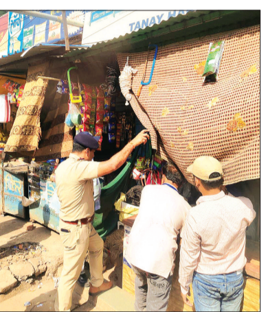
हरिभूमि न्यूज गुना

शहर की बिगड़ती यातायात व्यवस्था को दुरुस्त करने के लिए मंगलवार को प्रशासन ने सख्त तेवर दिखाए। अतिक्रमणकारियों और नियम तोड़ने वाले वाहन संचालकों के खिलाफ जोरदार अभियान चलाया। जिसमें एक ओर जहां जय स्तंभ चौराहा से बजरंगगढ़ रोड ओवरब्रिज तक सड़क पर कब्जा जमाए हुए दुकानदारों पर कार्रवाई करते हुए 8 हजार रुपए का जुर्माना वसूला गया तो दूसरी ओर वहीं 15 वर्ष से अधिक पुरानी एक बस को जब्त कर थाना यातायात में खड़ा कराया गया। अतिक्रमण विरोधी अभियान के तहत सड़क के दोनों ओर दुकानदारों द्वारा रखे