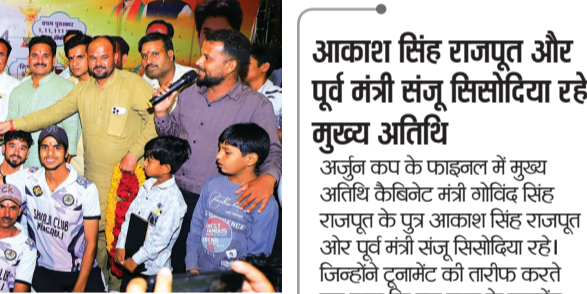
हरिभूमि न्यूज मुंगावली