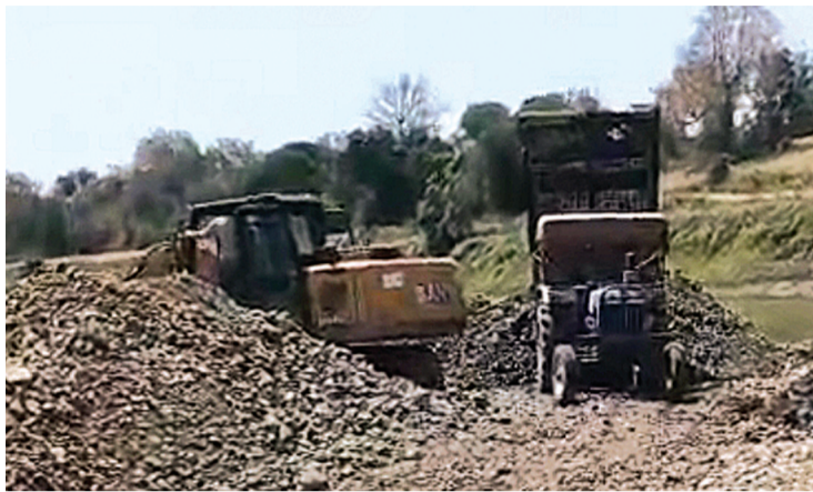
सुरक्षित कवचित से क्लब आ निकर की डी पर दूर रहे क्लबिन कवर, क्लिंकर आर रहे असन पवन

सेकनपुर में इन माफियाओं की भारी मशीनों और ओवरलॉड ट्रैक्टर ट्रॉली ने ग्रामीण इलाकों की सड़कों का दम निकाल दिया है। करोड़ों की लागत से बनी सड़कें अब सिर्फ धूल और गड़ों का ढेर रह गई हैं। आलम यह है कि सड़क पर डामर ढूँढने से भी नहीं मिलता, लेकिन इन उजड़ी हुई सड़कों पर दौड़ते ट्रैक्टर ट्रॉली अधिकारियों की नजरों से अज्ञान है।