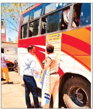
हरिभूमि न्यूज गुना

शहर की बिगड़ती यातायात व्यवस्था को दुरुस्त करने के लिए मंगलवार को प्रशासन ने सख्त तेवर दिखाए। अतिक्रमणकारियों और नियम तोड़ने वाले वाहन संचालकों के खिलाफ जोरदार अभियान चलाया। जिसमें एक ओर जहां जय स्तंभ चौराहा से बजरंगगढ़ रोड ओवरब्रिज तक सड़क पर कब्जा जमाए हुए दुकानदारों पर कार्रवाई करते हुए 8 हजार रुपए का जुर्माना वसूला गया तो दूसरी ओर वहीं 15 वर्ष से अधिक पुरानी एक बस को जब्त कर थाना यातायात में खड़ा कराया गया। अतिक्रमण विरोधी अभियान के तहत सड़क के दोनों ओर दुकानदारों द्वारा रखे