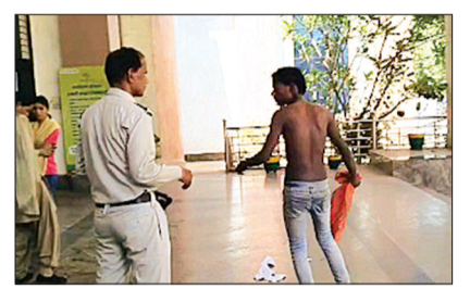
हरिभूमि न्यूज गुना

5 लाख लूट की शिकायत लेकर पहुंचा सुनवाई न होने का आरोप। कलेक्टर गेट पर जमकर हंगामा।