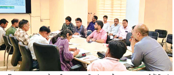
हरिभूमि न्यूज अशोकनगर

कलेक्टर साकेत मालवीय की अध्यक्षता में जिला उपार्जन समिति की बैठक मंगलवार को कलेक्टर सभाकक्ष में आयोजित की गई। बैठक में समर्थन मूल्य पर गेहूँ, चना, मसूर उपार्जन की व्यवस्थाओं की विस्तृत समीक्षा करते हुए निर्देश दिए कि किसानों को उपार्जन केन्द्र पर बेहतर एवं सुगम सुविधाएं प्रेषण, छाया, शौचालय एवं बैठने की सुविधाएं व्यवस्था उपलब्ध कराई जाए। बैठक में कलेक्टर ने निर्देश दिए कि केन्द्रवार नोडल अधिकारियों के साथ ही उपार्जन से जुड़े अधिकारी नियमित रूप से उपार्जन केन्द्रों का निरीक्षण करेंगे। जिससे व्यवस्थाएं सुचारु बनी रहे। केन्द्र पर किसी भी प्रकार की समस्या आने पर उसका त्वरित समाधान किया जाए। उन्होंने कहा कि प्रशासन का उद्देश्य किसानों को