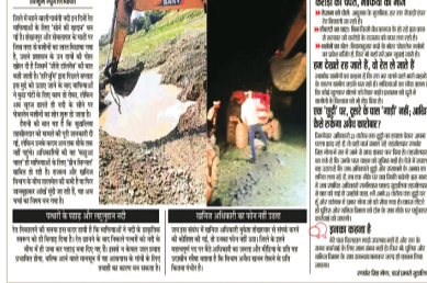
खनिज विभाग की कार्यप्रणाली पर सवाल: सबसे बड़ा सवाल खनिज विभाग की कार्यप्रणाली पर उठता है। खनिज अधिकारी किसी का फोन

कवचित अर्थात् क्लब से कवच की डी, क्लब क्लिंकर को पैतरा में क्लब-कवच को डी के डी का क्लब क्लिंकर