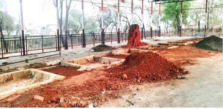
1961 में शमसान घाट पर बनाई गई धर्मशाला एक नई सोच